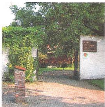
L'entrée vers la quiétude.